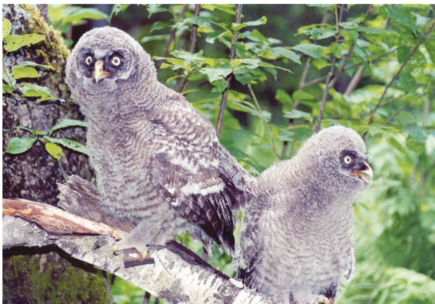
• Слетки бородачатой неясыти