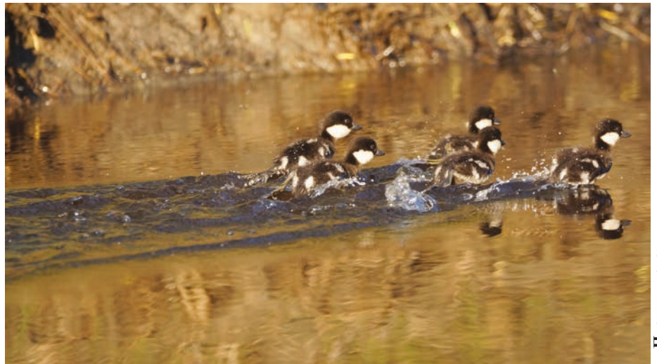
• Птенцы гоголя

Слётки – это птенец покинувший гнездо. Он уже почти оперён, но не умеет летать. У него и крылья-то ещё не выросли полностью. Покинуть гнездо его заставляет инстинкт: если подросшие птенцы будут долго сидеть в гнезде, то шансы на то, что их обнаружат хищники, многократно возрастают. Ведь птенцы в это время ведут себя довольно шумно, они кричат требуя еды, толкаются в гнезде, ставшим им