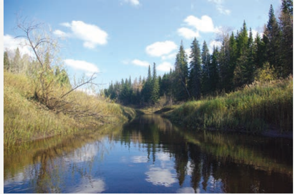
• Река «Нёгусь-ях» в малую воду

Летом река становится более спокойной, берега более высокими. Тёмно-бурые воды неторопливо текут на север, хорошо прогреваясь. Отступая, вода обнажает глинистую при-