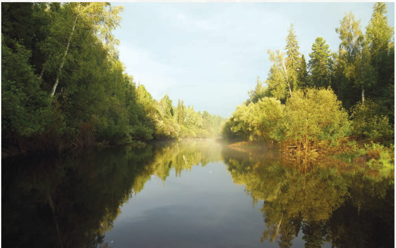
• Река «Нёгусь-ях». Среднее течение

брежную линию, обильно обрастающую хвощём и ежеголовником – любимыми кормами гусей гуменников. Достигнув максимального уровня воды, река мелеет и местами перестает быть судоходной. В реке встречается обычный для рек округа набор рыб: язь, плотва, елец, окунь, щука, ёрш, пескарь. В старицах – золотой и серебряный караси.