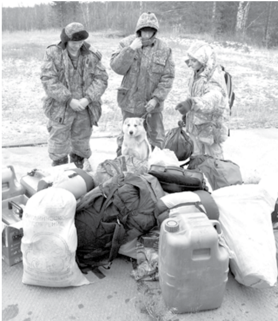
Очередная экспедиция лесной охраны вернулась с дальних кордонов

Но сравнивать площадь территорий западных стран с нашими просторами просто некорректно. В одном Сургутском районе вполне комфортно можно одновременно разместить Швейцарию и Исландию, и останется еще чуток для разбега. Как технически будет осуществляться развитие туризма на этой территории, какова будет стоимость туров - вопрос пока открытый. Может случиться и так, что их стоимость будет не по карману рядовому рос-