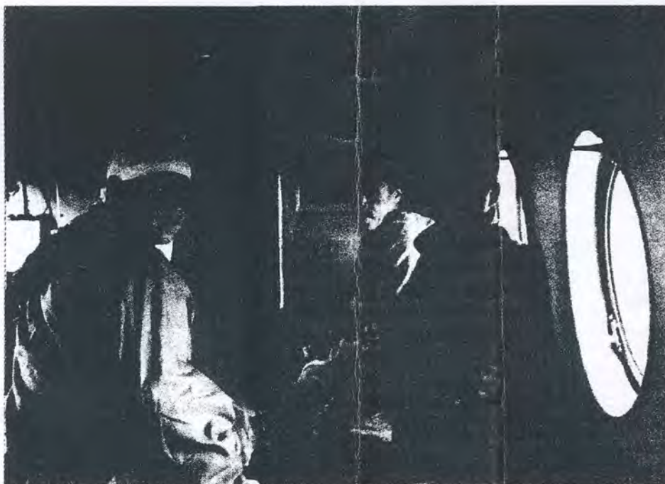
Оперативная группа отдела охраны.

В лесу нередко происходят происшествия, опасные, но порой и курьёзные. И хотя самым опасным для человека зверем яв-